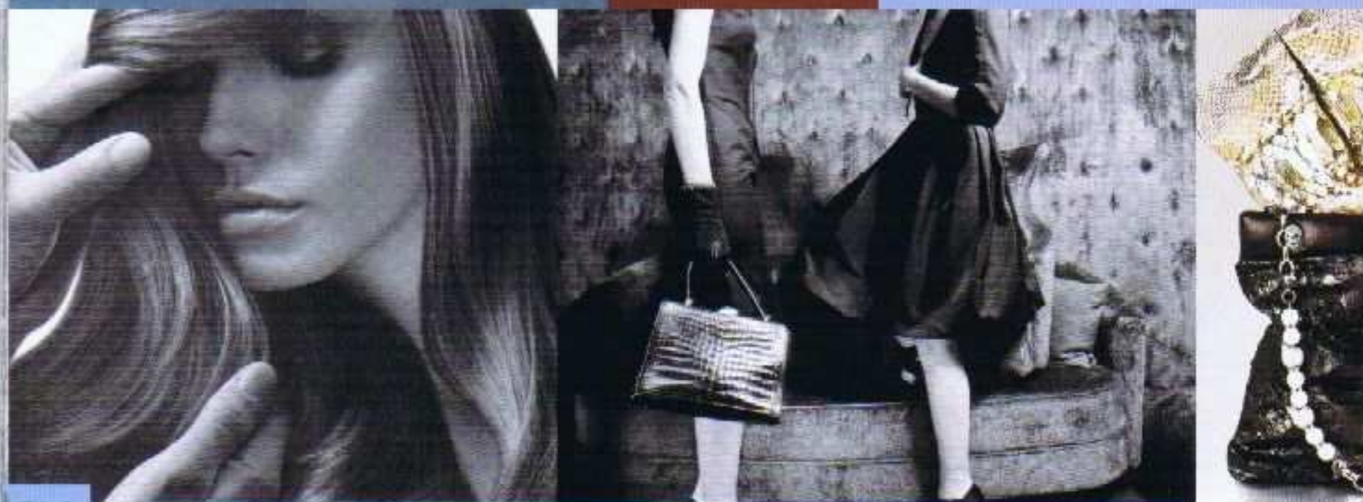
De beaux cheveux soignés selon Kérastase.